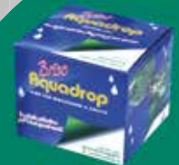
KIT AMPLIAMENTO 100 m 2