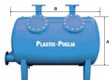
FILTRO A QUARZITE DOPPIA CAMERA